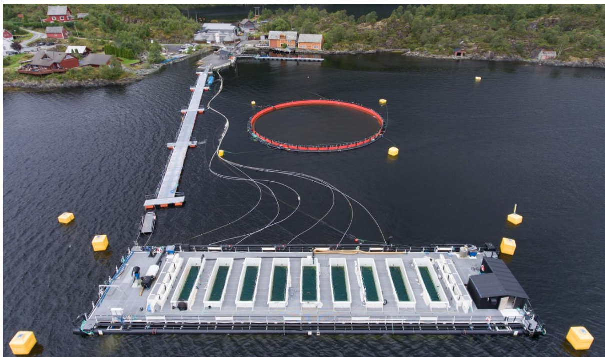
Figur 1 Tubmerd på lokalitet Sagen 2

Rapportering for 2018 i henhold til grønn tillatelse H-SR-5.